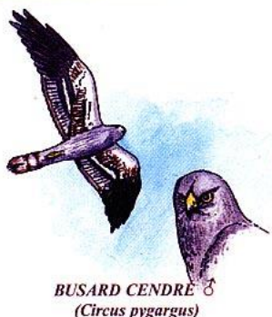
BUSARD CENDRE (Circus pygargus)