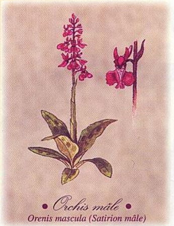
Illustration : Hervé LE GRAËT

Racheté par les communes d'illoud et de Bourg-Sainte-Marie, sa restauration fut entreprise par l'Association "Les Amis de Corrupt" au cours de l'été 1988.