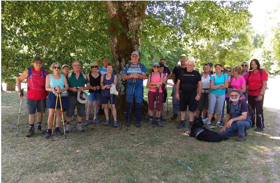
Randonnée à Liffol-le-Grand (88)