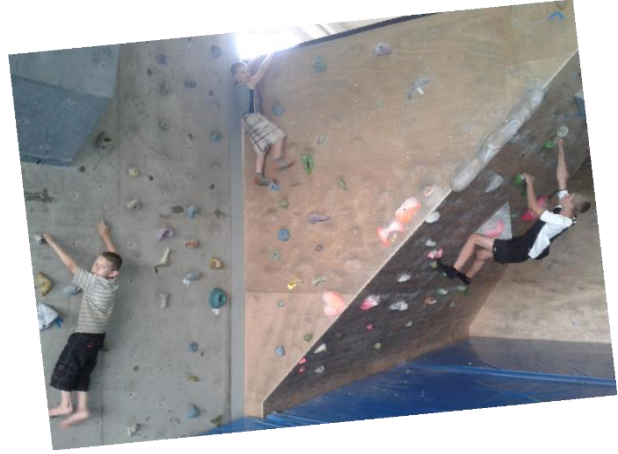
Mur d'escalade au gymnase de Bourmont