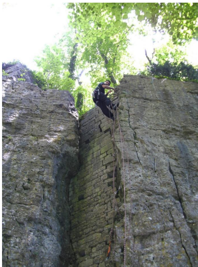
Site du Parc des Roches à Bourmont