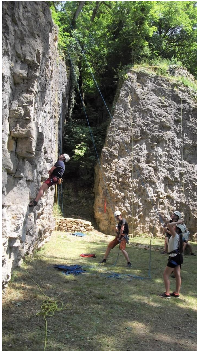
Site du Parc des Roches à Bourmont